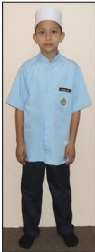
Contoh gambar pakaian seragam murid lelaki