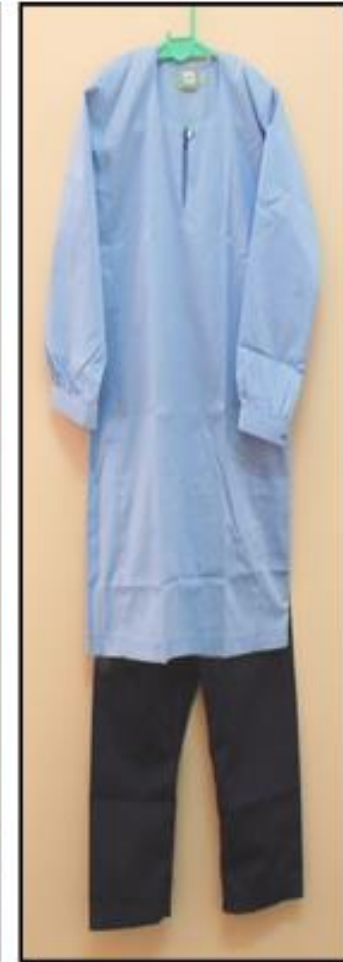
Banat Tahap 1