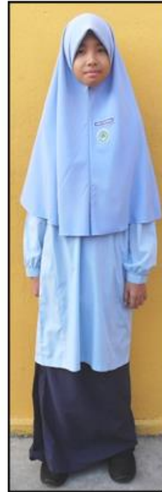
Banat Tahap 2